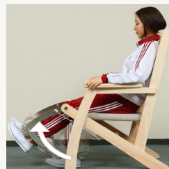
▲足を伸ばす運動(レッグエクステンション)

め、体力に合わせたトレーニングが可能です。1度に10回の運動を1日3セット行なうだけで、元気に歩くことができる体力が身につきます。また、ゆったりと座ることができるデザインなので、リラックスしてトレーニングを行うことができます。