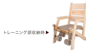
トレーニング部収納時▶