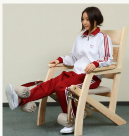
▲左右それぞれ異なるトレーニングをした場合