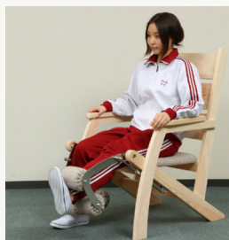
▲片方の足だけトレーニングした場合

あんどはトレーニング部が左右独立している高機能モデルです。片方の足だけのトレーニングや、左右の足でそれぞれ異なるトレーニングを行ったりと様々な使い方が可能です。